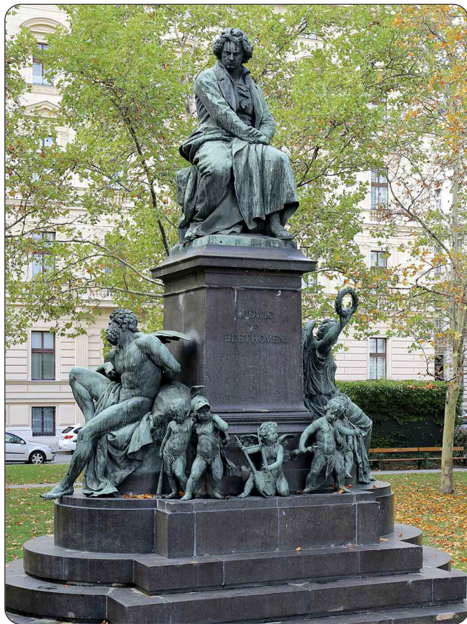
Beethoven-Denkmal in Wien