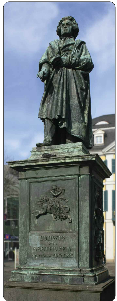
Beethoven-Denkmal mit Relief, Bonn

Mit Franz Brendels nun schon etwas in die Jahre gekommenen Ideenprojekt dürfte das Programm früherer und aller zukünftiger Geburtstagsfeiern weiträumig abgesteckt sein. Der Anhänger einer neudeutschen Schule ordnete Beethoven als „Komponist der neuen Ideen von Freiheit und Gleichheit, Emanzipation der Völker, Stände und Individuen“ (Brendel 1852, S. 324) ein und er-