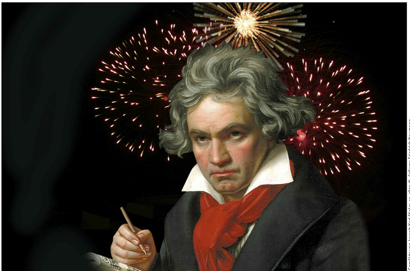
Gemälde von Joseph Karl Stieler, ca. 1820

„Was muss man nicht alles ertragen, wenn man das Unglück hat, berühmt zu werden“ (Beethoven 1975, S. 750). So äußerte sich Beethoven im Jahre 1825 in einem Brief an Ferdinand Ries und hatte hier wohl kaum eine Ahnung davon, was es für solch eine Berühmtheit bis heute